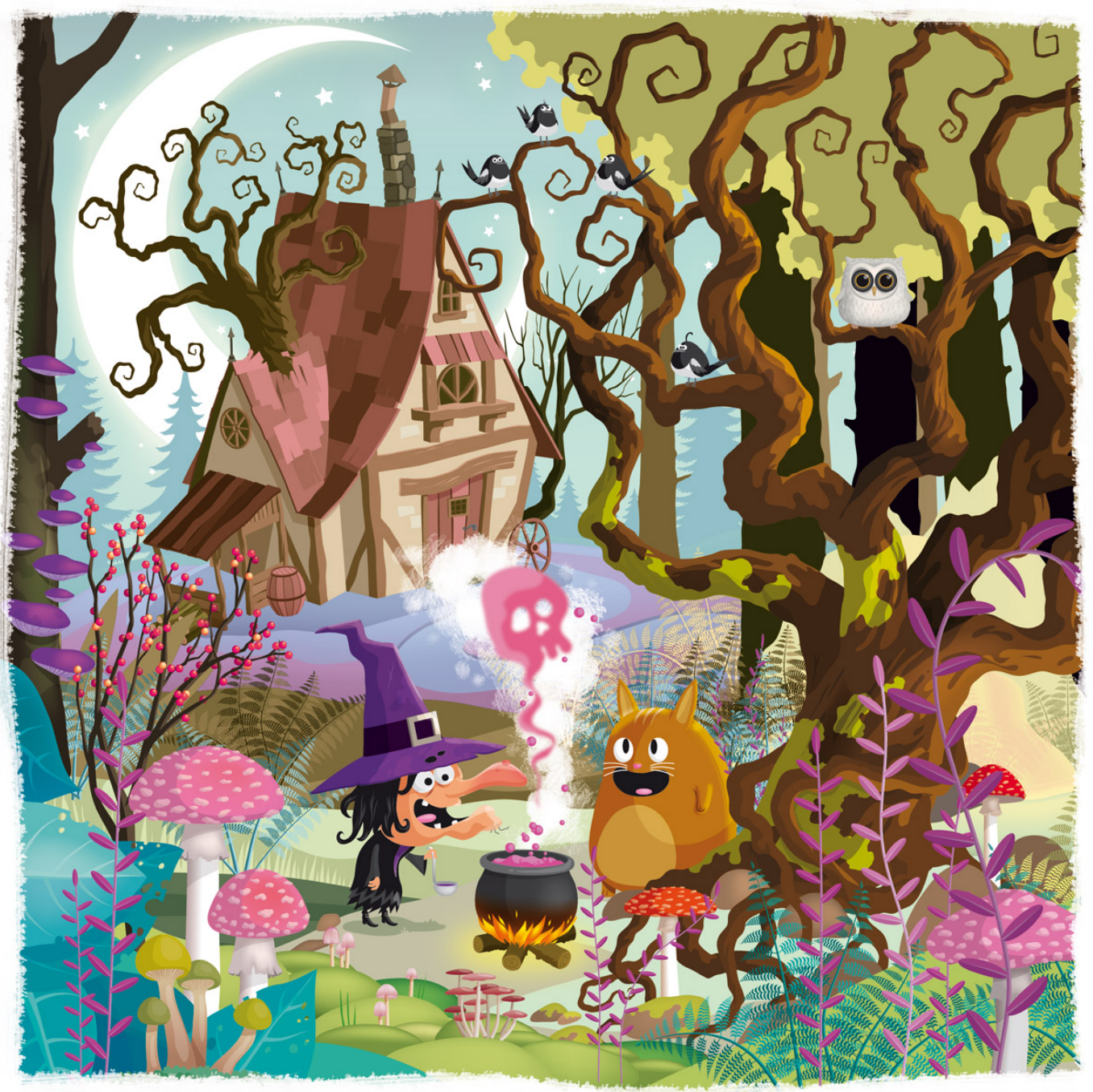
Rémy Tornior illustrateur freelance