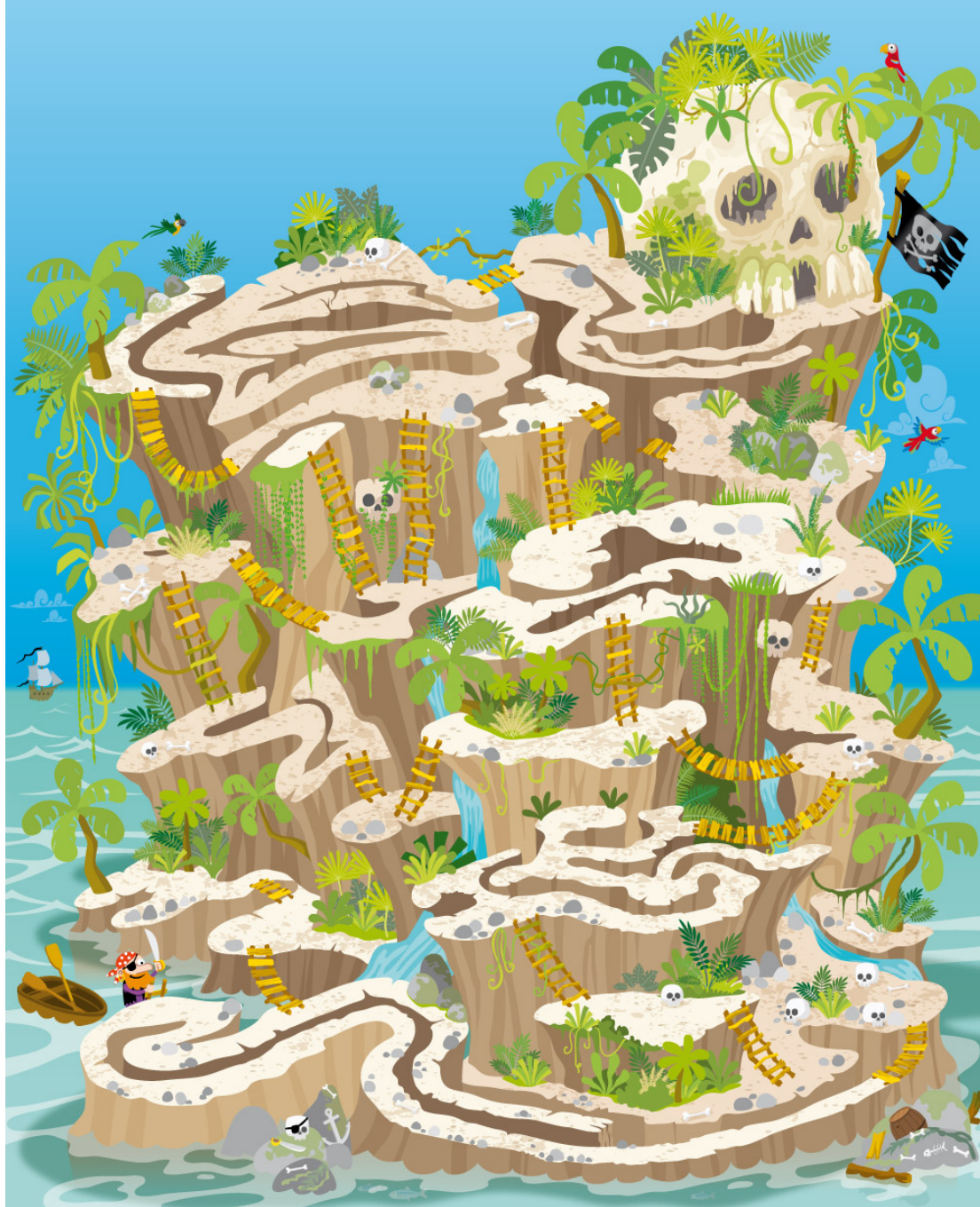
Rémy Tornior illustrateur freelance